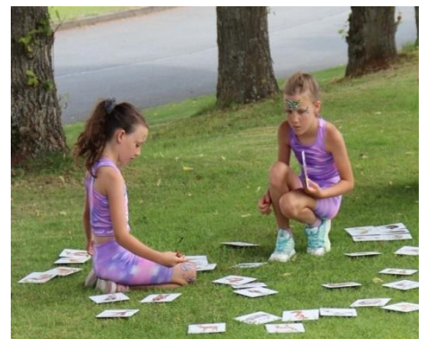
Kdo si hraje, nezlobí