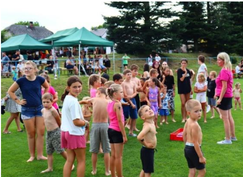
Příprava na balónkovou bitvu