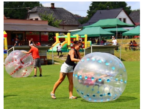
Trochu adrenalinu v zorbingu