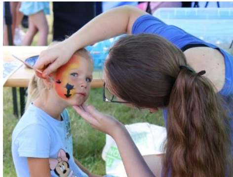
Malování na obličej