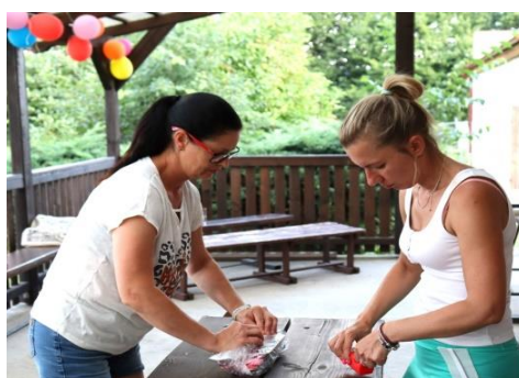
Tety ze Sparty připravují tombolu