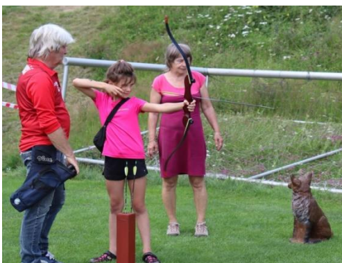
Lukostřelba pod zkušeným dohledem