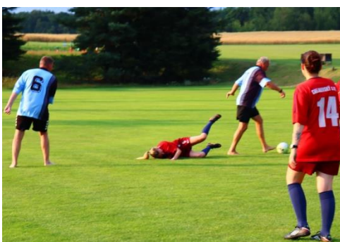
Tradiční utkání muži vs. ženy