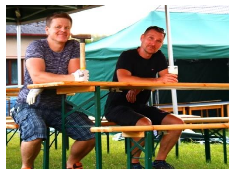
... a pánové přišli posedět...